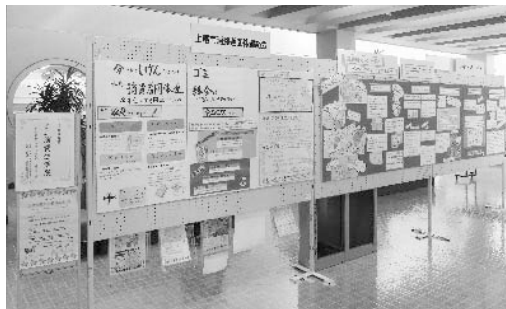
昨年の消費者月間ミニ消費生活展

暮らしに役立つ情報をまとめたパネル(食・環境などを展示します。 ■5月26日(金)～30日(火) ■コミュニティセンター ■市消費者団体連絡会による消費者啓発パネルの展示 ■消費生活センター☎75-0800・☎76-4600