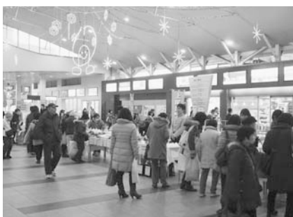
多くの人でにぎわう、あげお夕市

■市内で生産した季節の野菜や花などを農家が直接、販売します。 ■5月20日(土)16時~18時30分 ■JR上尾駅自由通路 ■農政課☎775-7384・☎775-9872