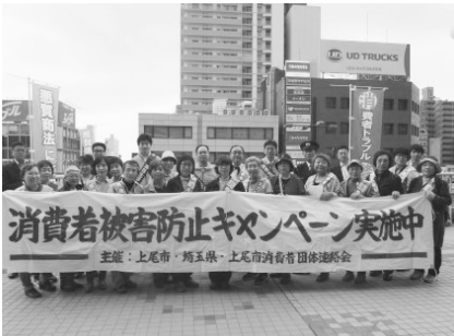
昨年行われたキャンペーン

5月の消費者月間に合わせ、消費者被害を未然に防止するため、市消費者団体連絡会・市消費者被害防止サポートの会・関東財務局・県・県警察が協力して、消費者被害防止キャンペーンを実施します。 ■5月16日(火)16時～ ■JR上尾駅自由通路、東西ペDESTリアンデッキ ■消費者被害防止を呼び掛け、啓発チラシ・消費者被害防止シールなどを千人に配布 ■消費生活センター ☎775-1080 0・FAX 776-4600