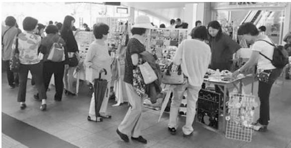
たくさんの作品が並ぶ春のあぴっと! マルシェ

■5月13日(土)10~16時 ■JR上尾駅自由通路 ■市内に在住の作家のハンドメイド作品の展示販売 ※出店作家の作品は、月替わりで「あぴっと!」でも展示販売しています。