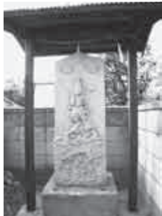
道路標示が刻まれている庚申塔

上平分署から東へ四十メートルも歩くと、左側の民家の宅地先に一基の庚申塔が立っているのが見えてくる。明和五(一