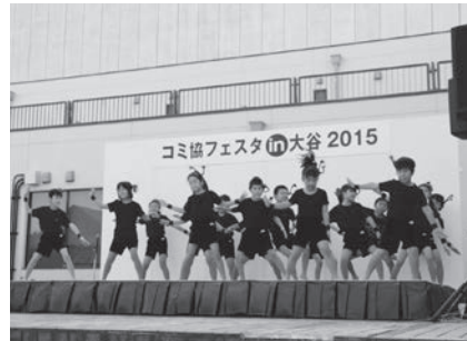
昨年のコミ協フェスタin大谷2015

フェスタin大谷2016実行委員会(大谷支所内) 所781-0121・所780-11113