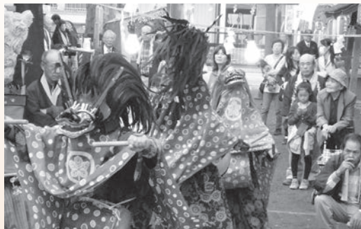
昨年の「畔吉のささら獅子舞」

畔吉ささら獅子舞は、王獅子、中獅子、牝獅子の計3匹で舞う「一人立ち三匹獅子」で、岩槻城主であった太田氏房が、馬に乗って見に来たという伝承があります。見どころは、隠れてしまった牝獅子を2匹の男の獅子(王獅子・中獅子)が争いながら見つける「牝獅子隠し」です。 ⑧宵祭り/10月8日(土)19時～、本祭り/10月9日(日)10時～、15時～、18時30分～ ⑨諏訪神社(畔吉835) ※9日10時～の上演だけ徳星寺(畔吉751)です。 【交通】JR上尾駅西口から“ぐるっとくん”平方丸山公園線で「畔吉」下車。東武バス利用の場合、西上尾車庫行きで諏訪神社は「前原」下車、徳星寺は「畔吉」下車 ※経路しない便がありますので注意してください。