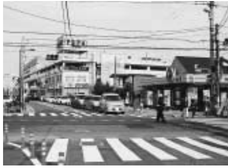
北上尾駅東口中山道交差点

当該個所は交通量が多く、交通渋滞が激しく、また北上尾駅の直近に位置し、駅への歩行者が年々増加している状況を見ると、安全で安心して歩ける歩道整備は最重要かつ緊急性があり、今後早期に県が事業に着手するようなお一層の働きかけをしていきたい。