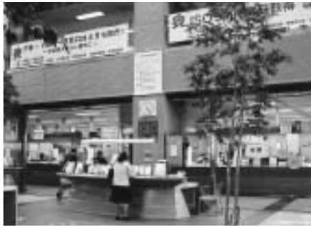
土日開庁を進めている市庁舎1階