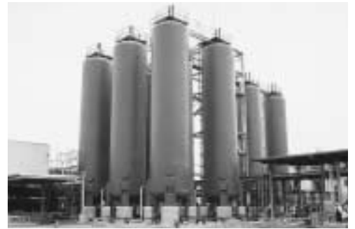
建設中のガス充てん場 (平方地内)

しかし、平成15年10月8日付で許可が出されたことから、市としては今後も地域住民と連携を図りながら、安全で安心して暮らせる