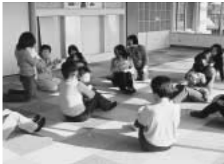
乳幼児相談センター初めての子育て教室

3月定例会の一般質問は、3月12・15・17・18日の4日間行われ、19人の議員が登壇し、市政全般53項目にわたって市当局の見解を求めました。また、この4日間で262人の皆さんが議会を傍聴しました。一般質問の主な内容は次のとおりです。