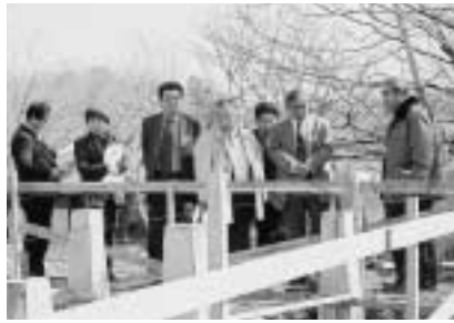
△ 丸山公園バーベキュー場を現地 調査する建設水道常任委員会