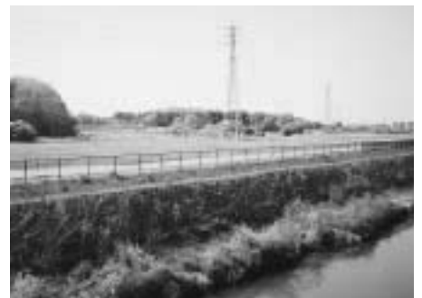
戸崎地区埋立跡地

昨年9月から11月にかけて、市内において不審者による事件が13件発生した。幸い大事に至らなかったが、この種の事件が頻発していることから、市内小・中学校の全児童・生徒に防犯ブザーを配布したところである。このブザーの使用方法や携帯の仕方などについては各学校で指導するとともに、各家庭にも文書で周知したところである。