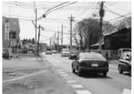
上尾平方線整備箇所

の計画決定であり、両側に3・5メートルずつの歩道をつくる予定になっている。駅の方から西側に向かって右側については、大谷北部第二土地区画整理事業で歩道の整備などを行う予定になっているので、16年度で左側の整備を完成させたい。