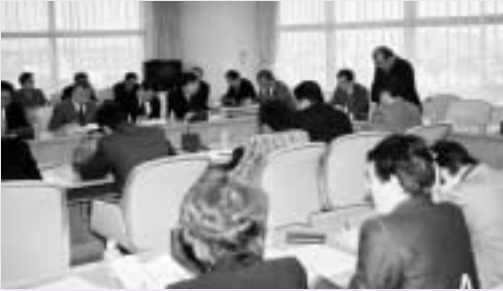
3回開催された合併問題調査研究会

上尾市議会では、桶川市及び桶川市議会からの合併協議の申し入れ(昨年8月)を踏まえ合併問題に関する調査研究を行うために、議員改選後の本年の1月及び2月に3回にわたって合併問題調査研究会を開催しました。