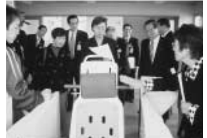
▷ 新生ホーム増築個所を現地 調査する福祉消防常任委員会