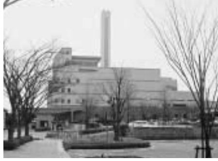
西貝塚環境センター

〈予算メモ〉 西貝塚環境センターの焼却炉内側壁耐火物の補修工事費として5,000万円を計上。 委員 焼却炉は今後どのくらいもつのか、またごみ焼却灰処分はどのように考えているのか。