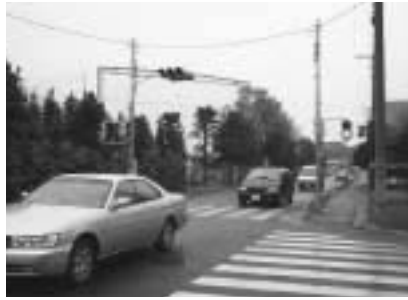
あんしん歩行エリアに指定された整備予定の浅間台地内

〈予算メモ〉 道路照明灯設置工事、道路反射鏡設置工事などの交通安全施設整備事業として6,133万5,000円を計上し350万円をあんしん歩行エリアに充当。