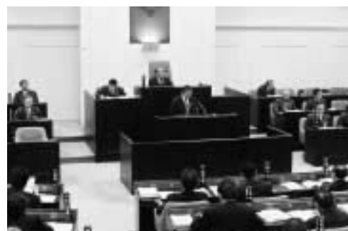
3月定例会市長の提案説明

市支所、保育所の老朽化に伴い、児童、子育て世代、高齢者が共に集える、総合的な地域コミュニティの拠点となるような複合施設を原市地区に建設するための経費を予算計上しました。