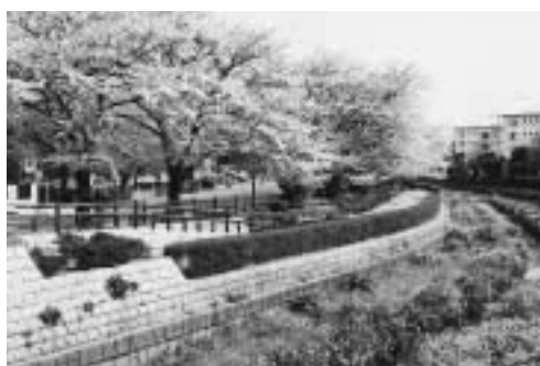
芝川の親水公園（文化センター前）

市民の憩いの場として芝川都市下水路のオープンスペースの環境は重要で、しらかばと団地周辺のせせらぎ水路、文化センター前の親水公園、東町小学校わきの桜並木など美しい景観となっている。市としては、芝川都市下水路側道用地の残地のポケットパーク化を図り、都市下水路周