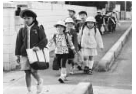
通学路の登校風景 (上尾小学校)

答 通学路における問題点としては、ガードレールや信号機の設置など交通安全上の問題、街路灯の設置や不審者対策などの防犯上の問題など多岐にわたっている。これらに対し、学校では保護者、地域の方々との情報を共有しながら、危険個所の把握はもとより、積極的に安全確保に対応している。教育委員会としては、特に昨今の不審者に対し、教職員、