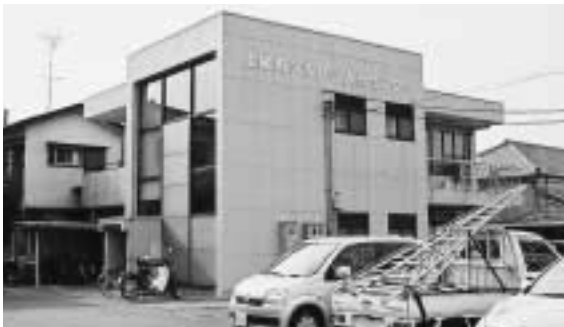
シルバー人材センター事務所 (大谷地内)

る経費を新たに予算計上しました。 「潤いのあるまち」では、緑化の推進及び緑の保全のため、当初予算において、みどりの基金に1億円以上の積立をします。 また、リサイクル・ごみ処理では、産業廃棄物を適正に処理し環境の保全を図ることを目的として、さいたま環境整備推進事業積立金への予算を新たに計上しました。 「安心・安全なまち」では、国から交通事故多発エリアとして指定を受けた市内のエリアについて、あんしん歩行エリア整備事業として、緊急的交通安全対策を講じるほか、道路交通の安全性向上のため、道路反射鏡、道路照明灯設置の私道への拡充に取り組みます。 J R上尾駅の改修については、駅機能の強化と子ども、お年寄りに使いやすいバリアフリー化を図