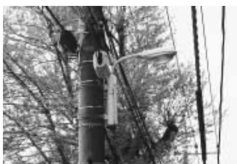
設置要望の多い道路照明灯