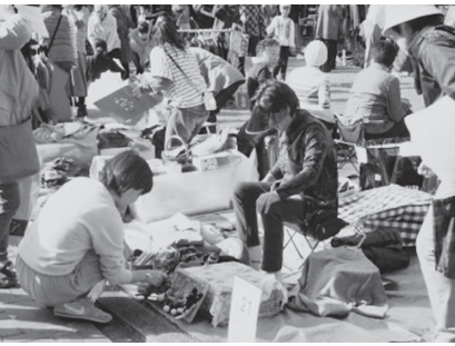
昨年のフリーマーケット

所、氏名、電話番号を記入して、10月17日(月)まで(必着に消費生活展実行委員会事務局 362-0075 柏座4-2-3 コミュニティセンター2階消費生活センター内)へ ※11月7日(月)に出店者説明会を行います。 消費生活展実行委員会事務局 775-0800・776-4600