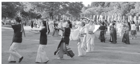
昨年の「あげお元気祭り」

時9月11日(日)11～16時 ※11時からセレモニーが あります。 所上尾丸山公園 内全国から集まっ た30団体によるよさこい・ダンス・和太鼓・阿波 踊り・生演奏、「めっちゃ旨市」(模擬店)、フリーマー ケット、がんよろず相談コーナー