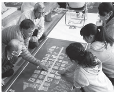
昨年のあげお郷土こどもかるた大会

㊨団体)上尾市青少年育成連 合会各地区会議や青少年団 体へ(一般)参加者の氏名、年 齢、住所、電話番号を直接ま たは電話、ファクス、メール(㊫ s106000@city.ageo.lg.jp) で青少年課へ ※駐車場に限 りがありますので、公共の交 通機関を利用してください。 ㊬青少年課 ㊭76-2488・㊮ 776-2117