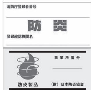
防災性能を示すマーク

時とき 所ところ 内容内容 対象対象 費用・金額 ※記載のないものは「無料」 定定員 持持ち物 申し込み ※記載のないものは「当日、直接会場へ」 問い合わせ