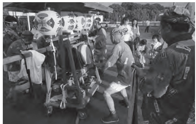
武州平方箕輪囃子連のタカウマでの演奏