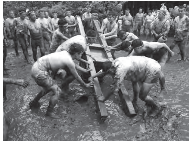
「隠居神輿」をもみ合う若衆たち

「平方祇園祭のどろいんきょ行事(平方のどろいんきょ)」は、平方上宿地区で行われる悪疫退散などを祈願する祭りです。白木造りの「隠居神輿」を担ぎ回って民家の庭などで転がし、水をまいて泥だらけになりながら激しくもみ合う勇壮な祭りです。 時 7月17日(日)13時～19時40分 所 八枝神社(平方)周辺 【交通】 JR上尾駅西口から、市内循環バス“ぐるっとくん”「平方丸山公園線」「平方小敷谷循環」で「平方神社前」バス停下車、または東武バス「平方方面行」で「平方」バス停下車 ※県立上尾橋高校の駐車場が臨時駐車場になります。