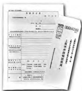
申立書と専用封筒

市政相談委員は、市政に対する苦情を受け、公正・中立的な立場で処理します。行政の制度に問題がある場合は、市に改善や是正を促します。 ④市政に対する苦情(原因となった事実があった日から1年以内のものに限る)で、直接利害関係がある人 ④市役所、各支所・出張所、主な公共施設にある「苦情申立書」に記入して、直接または郵送で広報広聴課(〒362-8501本町3-1-1)か各支所・出張所へ