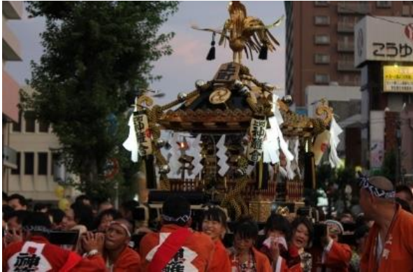
上尾夏まつりでの神輿渡御の様子