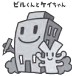
経済センサスキャラクター

学校、旅館、学習塾、病院、寺院など全ての事業所 ※事業活動を行っているれば、個人(農林漁家など一部を除く)も調査対象です。【調査方法】調査員調査/一定規模以下の事業所・企業に対して、県が任命した調査員(必ず調査員証を携行)が伺い直接、調査票を配布し、記入済みの調査票を後日回収する(インターネットでの回答も可) 本社等一括調査/国の契約する民間事業所が、組織の本社などに傘下の事業所の調査票を一括して郵送し、記入済みの調査票を郵送またはインターネットで回収する 国・県または市による調査/事業所に調査票を郵送し、回収する 【調査結果の利用】総務省・経済産業省で調査結果を取りまとめ、刊行物、インターネットなどで公表し、地方消費税の配分、国内総生産(GDP)など国民経済計算推計、経済対策など、国や地方公共団体の行政施策の重要な基礎資料として活用する