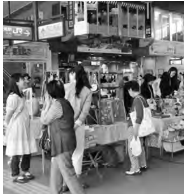
昨年の「あぴっと！マルシェ」

市内のハンドメイド作家が自身の作品を展示販売します。布小物・雑貨・アクセサリーなど、世界に一つだけの作品がたくさん出品されます。 ☎5月14日(土)10～16時 ㊟JR上尾駅自由通路