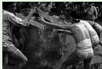
『魁』 ニチローさん(上尾市)の作品