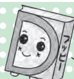
あっぴい がっくるのキャラクター「フッピー」

子どもの読書活動支援センター 【開館時間】10:00~16:30 所 柏座4-3-8富士見小学校内 ☎・☎773-3711