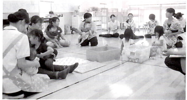
和やかな雰囲気の中、親子で交流

による手遊び、身長・体重測定など 内容ふたご・みつごの親子(0歳～未就学児)、ふたご・みつごを妊娠中の妊婦 内容母子健康手帳、おむつ、飲み物など