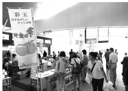
昨年のあげお朝市

ます。 ※「黄金の栗」とは、上尾市と伊奈町で生産された日本ナシ「彩玉」のうち、糖度13度以上で重量500g以上の基準を満たしたものです。 【時】 8月22日(土)10時〜12時30分 【所】 JR上尾駅自由通路 【市】 農政課☎75-7384・☎75-9872