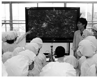
カルピスの原料の乳酸菌の観察

に住所、氏名(ふりがな)、性別、学校名、学年、保護者氏名、電話番号を記入して、8月10日(月)まで(必着)に消費生活センター(〒362-0075 柏座4-2-3コミュニティセンター)2階へ 【消費生活センター】 ☎75-0800・☎76-4600