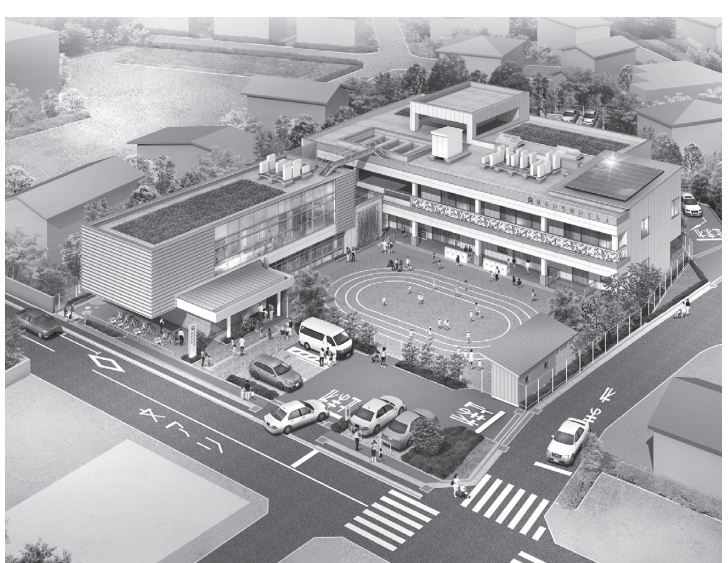
(仮)原市保育所複合施設完成予想図(全景)