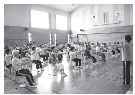
アッピー元気体操の様子