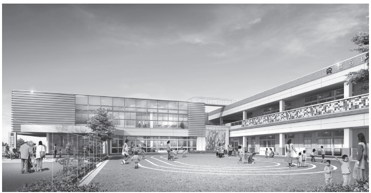
(仮)原市保育所複合施設完成予想図(正門付近)