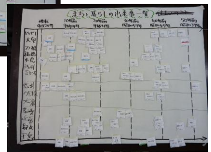
まちと暮らしの出来事一覧「家歴編」