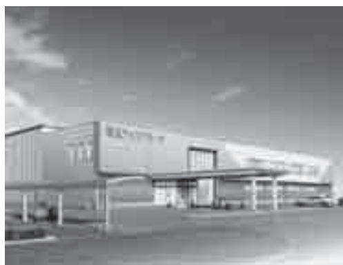
埼玉アイスアリーナ外観図

【開館時間】10～18時(金)土20時15分まで) ※年中無休です。 ⑧日の出4丁目36(さいたま水上公園内) ※利用料金など詳しくは埼玉アイスアリーナホームページ(⑨ http://www.saitama-icarena.com/)をご覧ください。