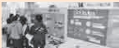
昨年のくらしフェスタ

☎11月22日(土)・23日(日)10～15時 所 上尾市コミュニティセンター ☎情報パネル展示(食・環境・福祉・防災など)、クイズラリー、手作り製品販売、フリーマーケット、廃油石けん作り、体組計測定、暮らしとお金の相談、ユニバーサルカフェ、農産物販売と包丁研ぎ(23日(日)だけ)など ☎一部を除き無料 ☎イベントにより事前申し込みが必要 ※詳しくは実行委員会事務局へお問い合わせください。