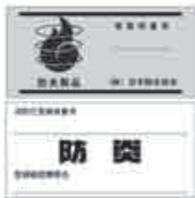
防火性能を示すマーク

一定の防火性能を持つ製品には、左図のようなマークが付いていますので、購入する時の目安にしてください。