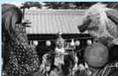
昨年の藤波のささら獅子舞

江戸時代から伝承されている民俗芸能「藤波のささら獅子舞」は、男の獅子2匹と女の獅子1匹、先導・道化役の猿若の4人一組で演じられる獅子舞です。終盤では、隠れてしまった女の獅子を2匹の男の獅子(雄獅子・中獅子)が争いながら見つける「雌獅子隠し」が演じられます。 ⑧10月5日(日)14時～、17時～、20時～の3回上演(雨天決行) ⑧天神社(藤波一丁目) 【交通】JR上尾駅西口から市内循環バス“ぐるっとくん”[大石循環]で「藤波公民館」バス停下車 ※経路しない便がありますので注意してください。