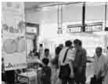
あげお朝市で「黄金の栗」を販売

本梨「彩玉」の上尾・伊奈ブランド「黄金の栗」の試食販売があります。 ※「黄金の栗」は上尾市と伊奈町で生産され、糖度13度以上で重量500g以上などの基準を満たしたものです。 時8月30日(土)9時～11時30分 所JR上尾駅自由通路 閩農政課☎75-7384・☎75-9872