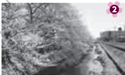
川辺に咲く菜の花とのコントラストは絶妙 児童館アッピーランド

屋には桜並木の下で花見や散策がおすすめ。さくらまつりの期間中はライトアップされ夜桜が楽しめます。 所 ニツ宮750 P約260台 伊有 Ⓛ 原市循環または上平循環「市役所前」下車