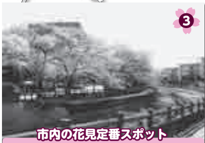
市内の花見定番スポット 上尾市文化センター

屋には桜並木の下で花見や散策がおすすめ。さくらまつりの期間中はライトアップされ夜桜が楽しめます。 所 ニツ宮750 P約260台 伊有 Ⓛ 原市循環または上平循環「市役所前」下車