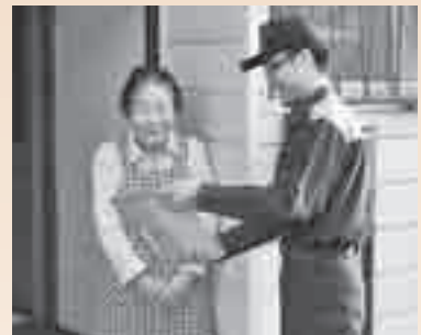
消防職員の防火訪問