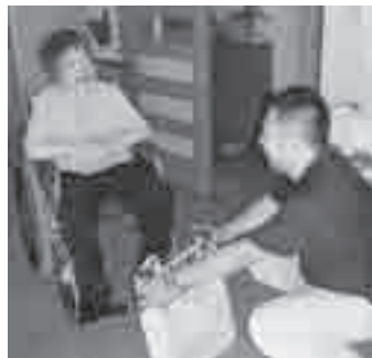
戸別に訪問してごみを収集

包括支援センターなどのケアマネジャー、地区民生委員・児童委員に相談してください。