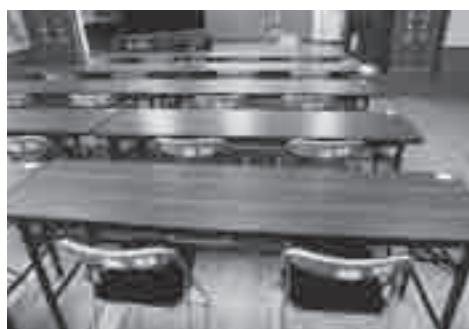
購入した机といす