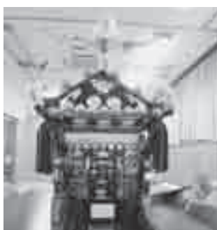
修繕された子ども神輿