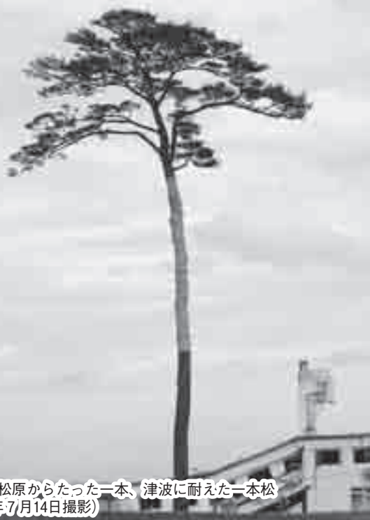
7万本の松原からたった一本、津波に耐えた一本松(平成23年7月14日撮影)

※詳しくは陸前高田市ホームページ(☎ http://www.city.rikuzentakata.iwate.jp/ )の「奇跡の一本松」をご覧ください。