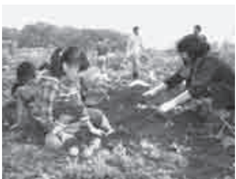
昨年の農業体験教室