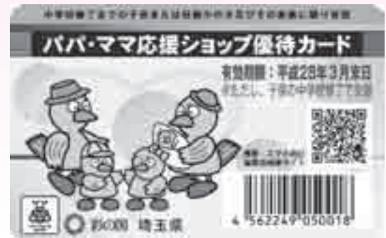
新しいパパ・ママ応援ショップ優待カード

医療費を受けるためには申請が必要で、認定になった場合、申請日から医療費が支給されます(平成24年8月1日時点で裁判所からの保護命令を受けていた人は、4月1日〈月〉までに申請すれば平成24年8月1日にさかのぼって医療費を支給)。申請に必要な書類は、申請する人の状況によって異なりますので、事前にこども支援課(市役所2階⑤番窓口)に問い合わせてください。