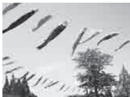
上平公園に掲げたこいのぼり(昨年)