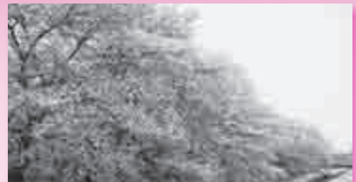
児童館アッピーランド芝川対岸