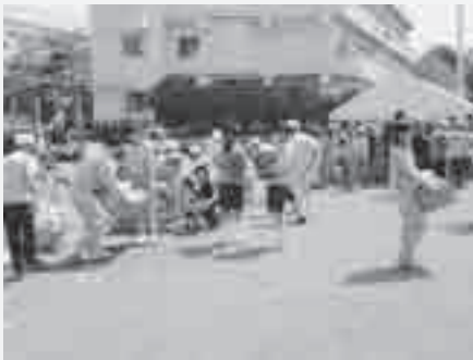
尾山台団地運動会でのボランティア

昨年9月に、作業着に「がんばろう東北」と刺しゅうを施すボランティアを行いました。刺しゅうの作業は、東日本大震災の被災地でがれきの撤去作業を行う人たちに使用され、被災地復興の手助けをすることができました。