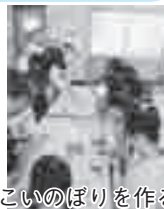
こいのぼりを作る