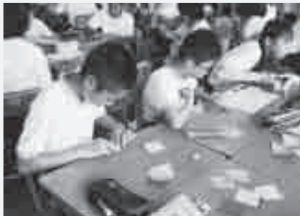
平和を祈って千羽鶴を折る

ユニセフ募金活動も活発で12月に生徒会役員が中心になって集めます。いつも目標金額より多く集まり、貧しい国々の子どものための支援に役立っています。