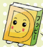
あっぱいぶっくるのキャラクター「あっぱい」

子どもの読書活動支援センター 【開館時間】10:00～16:30 所柏座4-3-8富士見小学校内 TEL・FAX773-3711