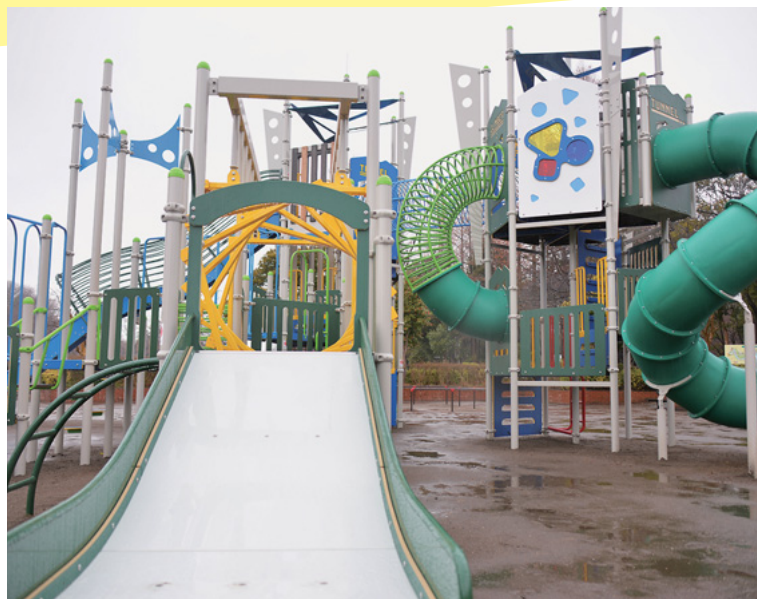
リニューアルした大型遊具

3月14日、市役所で市内循環バス“ぐるっとくん”EVバスお披露目式が行われました。4月から“ぐるっとくん”の増便運行を開始するとともに、増車するバス車両の一部で電気自動車(EV)が導入されました。EV車両は、通常のバスと比べて車内の振動が少なくなる他、走行による排気ガスもなく、走行音も小さくなります。お披露目式に併せて乗車会も行われ、参加者からは「思ったよりも揺れが少なく、乗り心地が良かった」との感想が聞かれました。人にも環境にも優しい、新しい“ぐるっとくん”が今後、上尾の各地で活躍します。