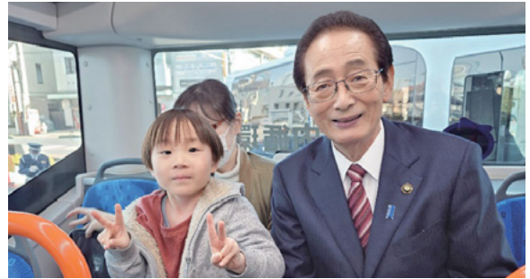
EVバスに試乗する富山市長