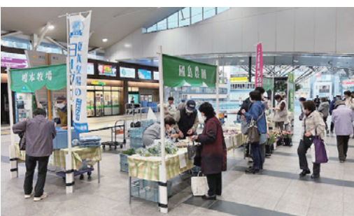
利用客でにぎわうあげお夕市