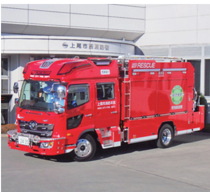
更新した救助工作車

西消防署の救助工作車を更新しま した。この車両は、多種多様な災害 に対応するために、救助資機材を積 載し、ウインチ(巻き上げ機)、照明 装置、クレーンなどの特殊装備を取 り付けていて、「レスキュー車」とも 呼ばれています。