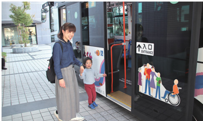
“ぐるっとくん”EVバスに試乗する参加者

3月14日、市役所で市内循環バス“ぐるっとくん”EVバスお披露目式が行われました。4月から“ぐるっとくん”の増便運行を開始するとともに、増車するバス車両の一部で電気自動車(EV)が導入されました。EV車両は、通常のバスと比べて車内の振動が少なくなる他、走行による排気ガスもなく、走行音も小さくなります。お披露目式に併せて乗車会も行われ、参加者からは「思ったよりも揺れが少なく、乗り心地が良かった」との感想が聞かれました。人にも環境にも優しい、新しい“ぐるっとくん”が今後、上尾の各地で活躍します。