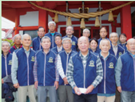
上尾の歴史や伝統を伝え、つなげる あげおアップピーガイドの会 (P.13)