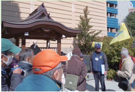
氷川御神社でのガイドの様子

て翌2011年1月に発足しました。発足時のメンバーは全員観光ガイドの経験はなく、上尾市についての知識もほとんど持ち合わせていなかったため、古老に話を伺ったり図書館に通い文献を丹念