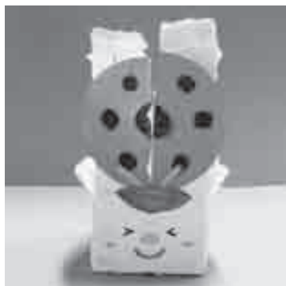
てんとう虫の小物入れ

▶とき 6月17日(日)①午前11時～正午②午後2時30分～3時30分 ▶内容 牛乳パックでてんとう虫の小物入れを作る ▶対象 市内に在住の4歳児以上(小学2年生以下は保護者同伴) ▶定員 各回20人(先着順)