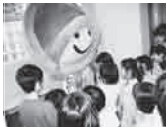
5月3～5日に行われたアッピーウイーク