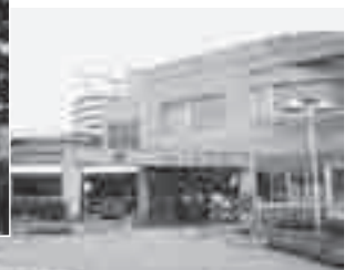
児童館アッピーランド