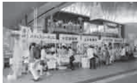
昨年の駅deほっと市

▶とき 6月30日(土)午後2～6時 ▶ところ JR上尾駅自由通路 ▶内容 市観光協会推奨土産品を中心に岩手県陸前高田市と福島県本宮市の土産品などを販売