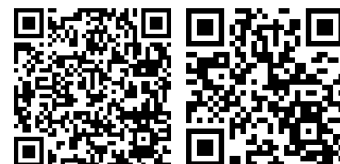
電子出願システム 志願者用マニュアル 電子出願システム 動画ヘルプ