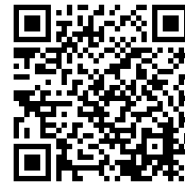
電子出願の利用の手引き

電子出願システムでは、保護者の方に実施していただく部分もありますので必ず手引きを一読してください。