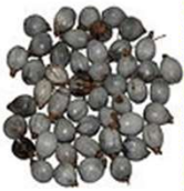
ジュズダマ

原市沼の蓮池では、ハトムギ科のジュズダマが沢山実ってきました。ジュズダマは、お手玉やミサンガ、首飾りなどに使えます。採取もできますので、関心のある方は是非お越しください。また、蓮の果托も差し上げます。