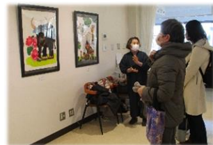
▲熱心に鑑賞する来場者