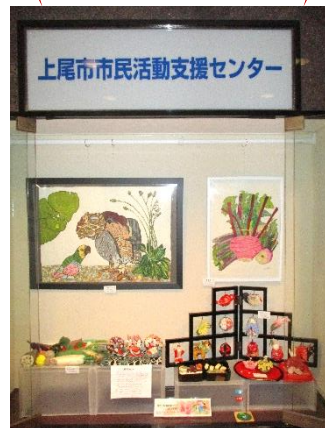
▲ちりめんで作ったつるしの置物が目を惹きます