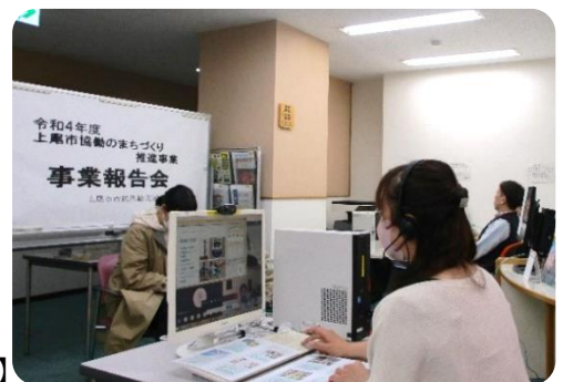
【リモートで報告する発表者】

3月23日(木)上尾市協働のまちづくり推進事業の事業報告会をリモートで開催しました。協働事業を実施した市民活動団体4団体と市の担当課が事業報告を発表しました。令和4年度は、依然コロナ禍の影響もありましたが、子どもの居場所づくり、不登校支援、子育て支援、女性のヘルスケアといった市民ニーズの高い課題に、それぞれの団体が得意とすることを生かし、創意工夫しながら取り組んだことで、高い事業成果を得られたと市民活動推進協議会の委員の皆さんから講評を受けました。