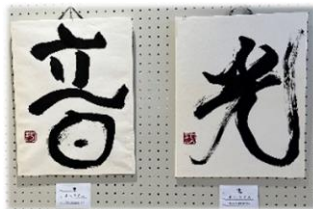
▲躍動感ある筆はこび

毎年2月に作品展を開催しており、今年もコミュニティセンターで『ひだまりの小さな書作展』が開催されました。“ひだまり”という愛称には、多くの人に見てもらえる喜びと、同じ障がいのある方々に、障がい児者芸術クラブの存在を知ってもらい、明るい希望を届けたいという願いが込められています。開催中、多くの来場者が訪れ、感性あふれる書や絵に見入っていました。